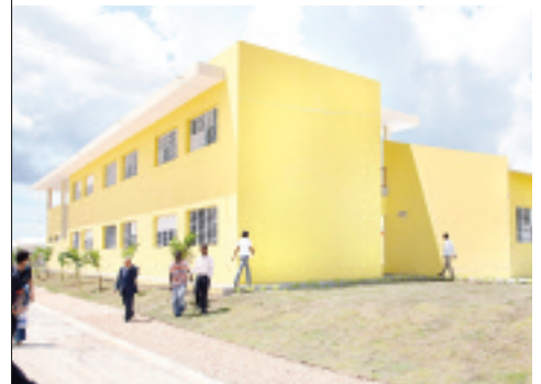
Vista de la Escuela Atabeira, de Nuevo Cayacoa, que acogerá a unos 600 estudiantes para los niveles de pre-escolar, primaria y secundaria.